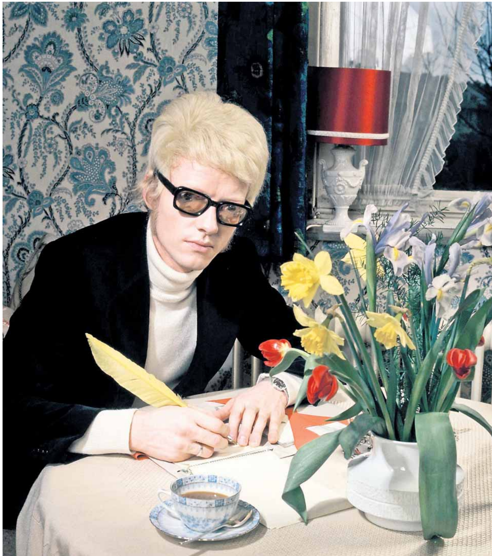
Damals konnte man ihm noch in die Augen sehen: Heino im Jahr 1969 in seiner Düsseldorf-Wohnung.